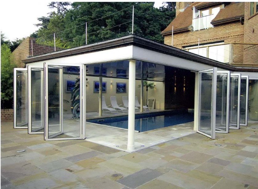
Faltwand als Pool-Verglasung

Balkon-, Sitzplatz-, Showroom- und Sommergarten-Verglasung, Balkongeländer, Bürotrennwände, Windfang.