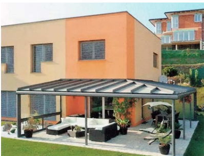
Terrassendach um die Hausecke

Terrassendächer, Carports, Schwimmbadüberdachungen, Pergolen, Eingangsüberdachungen.